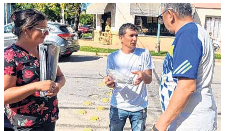
OPERATIVOS. Suman 12 los casos informados hasta la fecha por el Ministerio de Salud. Se recomienda extremar las medidas de prevención.

Los agentes sanitarios realizan visitas casa por casa en un anillo de 9 manzanas alrededor del domicilio del paciente, buscando otros casos con sintomatología febril