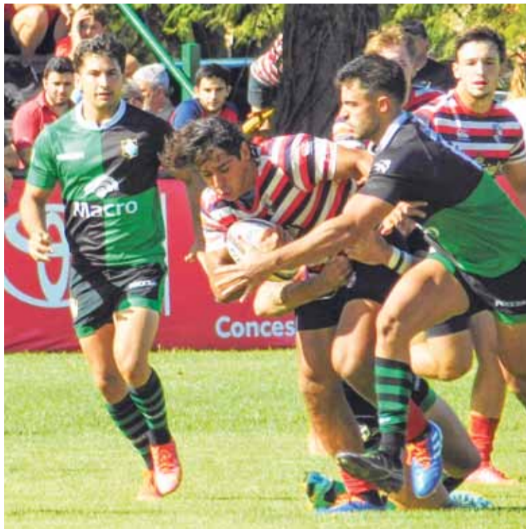
Paso en falso. Santa Fe Rugby no pudo con Duendes y cayó en Sauce Viejo.

tuvo una buena tarde en cuanto al resultado, sino que estuvo lejos de haber hecho un buen partido, en un contexto de mucha paridad, en el cual prevaleció el trabajo de las defensas, pero como le sucedió en partidos anteriores, cometió muchos penales, y en este caso Duendes los aprovechó. A lo que