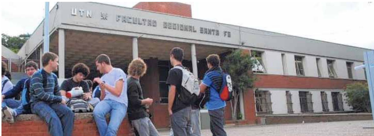
INGRESANTES. Todas las ingenierías vieron incrementada su matrícula respecto al año pasado.

La gran posibilidad de trabajo a corto plazo es moneda corriente en gran parte del territorio producto de que es un recurso humano escaso. La buena noticia es que en los últimos años y de primera mano en el espectro santafesino se mantiene un constante crecimiento en la matrícula de nuevos aspirantes e ingresantes a algunas de las ingenierías más calificadas en el ámbito laboral actual, sumado a una mayor cantidad de aspirantes mujeres que crece año a año.