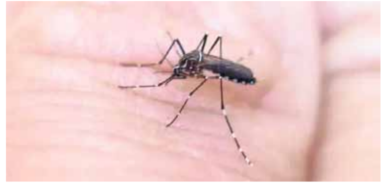
ENFERMEDAD. No hay vacuna ni tratamiento específico para el dengue.

Rellenando los floreros y portamacetas con arena húmeda, manteniendo los patios y jardines limpios, ordenados y desmalezados. Limpiando canaletas y desagües de lluvia de los techos. Tapando los tanques y recipientes que se usan para recolectar agua y vertiendo agua hirviendo en las rejillas y colocándoles tela mosquitera.