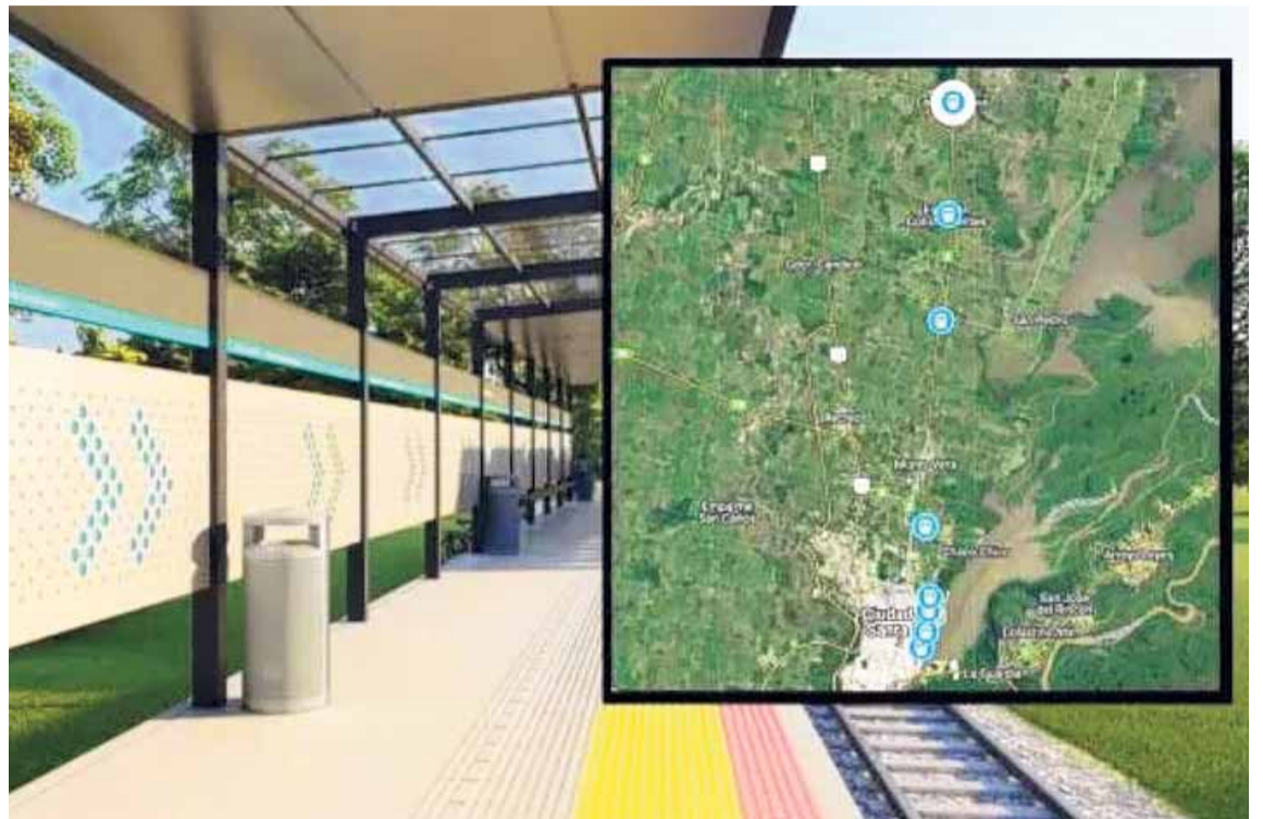
BIENVENIDOS AL TREN. Para cubrir el trayecto, ya hay una locomotora y tres vagones con capacidad para 100 pasajeros sentados cada uno.

Luego de la estación de Ángel Gallardo las formaciones pasarán por la comuna de Monte Vera, las estaciones de Arroyo Aguiar y Constituyentes para concluir en