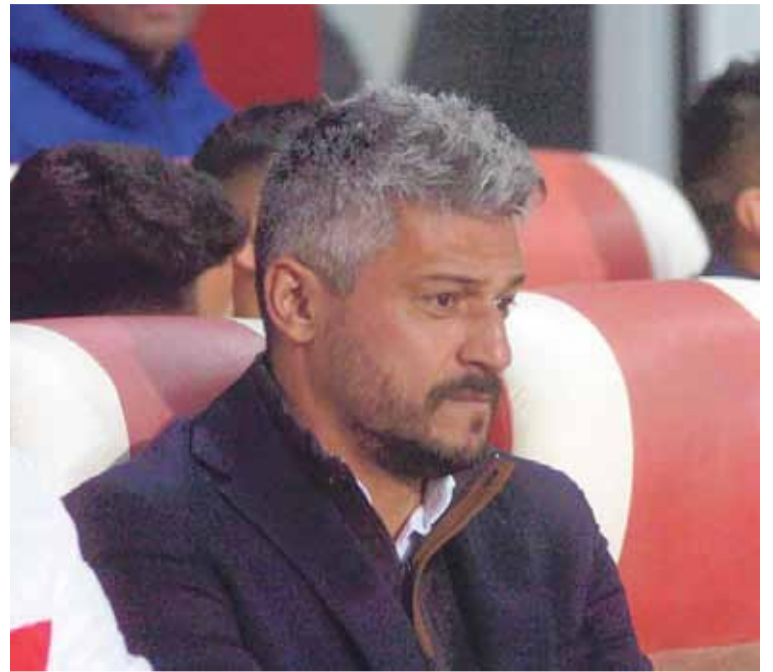
A todo o nada. Un resultado negativo podría ser decisivo para la continuidad del DT.

ces que un mal resultado pueda ser el detonante para la continuidad de Munúa, mientras que, en caso de salir airoso del Monumental, luego la relevancia de esta situación se trasladaría al duelo ante Belgrano, que seguramente será a todo o nada para