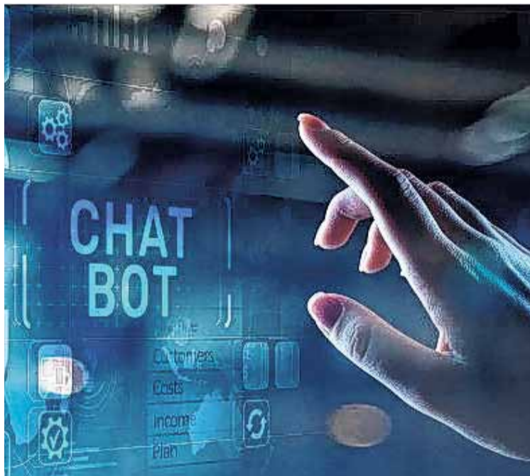
USO. Los programas de inteligencia artificial (IA) ya están siendo utilizados por los estudiantes en escuelas y universidades gracias a la capacidad de los chatbots de dar respuestas acertadas y completas.

“Acá explotó el uso de los chatbots de inteligencia artificial, es el tema número uno de la agenda