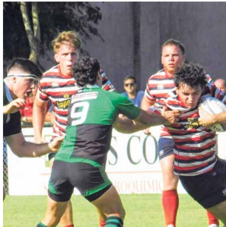
Fin de la racha. La escuadra de Sauce Viejo había ganado los dos partidos que había jugado en el TRL.

Por la cuarta fecha de Segunda División, La Salle Jobson fue impiadoso con Universitario de Santa Fe en la Granja la Esmeralda y lo derrotó por 50