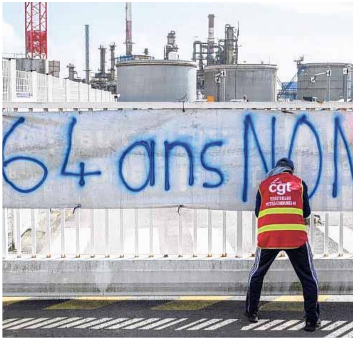
PROTESTAS. La edad jubilatoria en Francia pasará de 62 a 64 años en 2030.

A su juicio, esta decisión afecta a los trabajadores con menos formación que ingresaron pronto al mercado laboral, y a las mujeres, que deben interrumpir sus carreras por la maternidad, que terminarán en “una bolsa de precariedad” al final de su vida profesional en un país con una tasa de empleo de apenas 33% para los 60-64 años, según los datos oficiales.