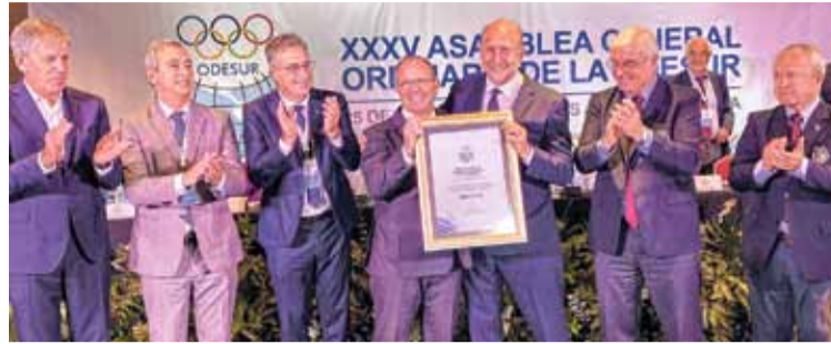
Es oficial. Santa Fe fue elegida oficialmente como sede de los XIII Juegos Suramericanos 2026.

Moccia destacó que "Santa Fe es un ejemplo de convivencia democrática: el gobernador es de un signo político y los intendentes son de otros signos políticos, y trabajan mancomunados para cumplir su sueño que es organizar los Juegos Suramericanos. Estamos realmente felices de esta propuesta, y orgullosos de que podamos soñar nuevamente con organizar los Juegos Suramericanos en Argentina". Por su parte, Perotti expresó: