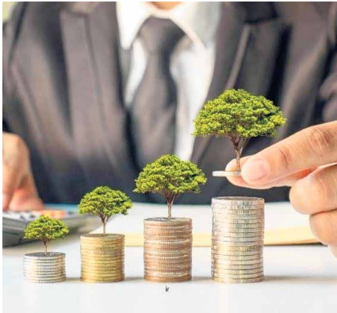
INVERSIÓN. A partir de abril, el plazo fijo tradicional puede llegar a perder, en base a si se cumplen los pronósticos más pesimistas de inflación.

En tanto, los analistas consideran que estas cifras posicionan al plazo fijo UVA, que es el ajuste por precios de la economía, como el más seductor, al menos hasta