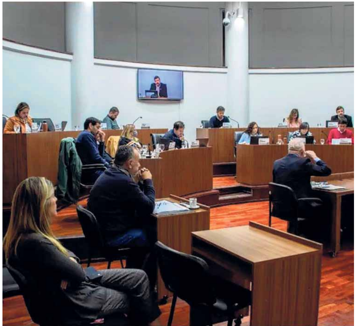
CRUCES. Los ediles discutieron sobre un tema que siempre vuelve: qué hacer con los cuidacoches.

“La mayor responsabilidad de la situación acerca de los cuidaco-