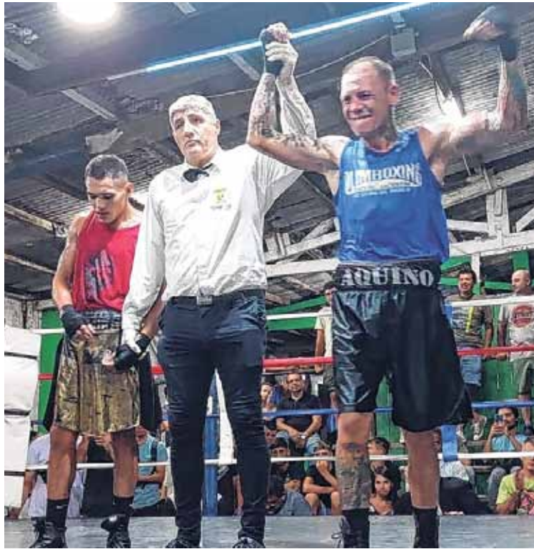
Campeón. El santafesino festeja la obtención del cinturón del Dos Orillas.