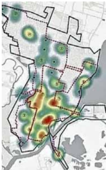
MAPA DE CALOR. La mayoría de ellos viven en el centro de la ciudad.

Con respecto a la situación laboral de las personas relevadas, un 70% ha respondido que ha trabajado en la última semana. De la población que ha respondido que no realiza ninguna actividad laboral (27%), casi el 59% ha refe-