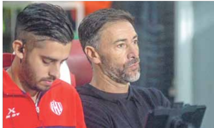
Satisfecho. El DT de Unión sacó pecho tras la victoria en el final sobre Banfield.