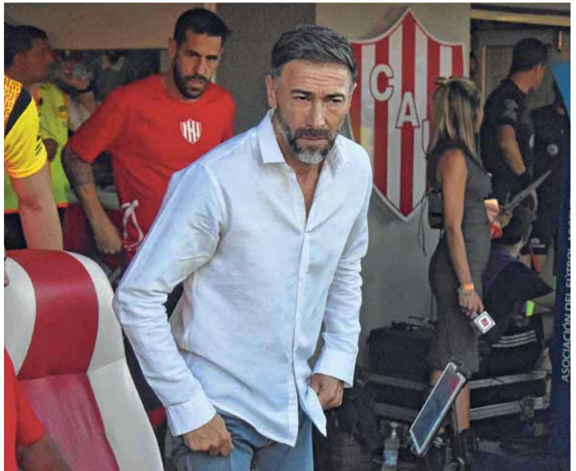
Cuestionado. Todos los cañones apuntan a Kily González tras una nueva derrota de Unión.