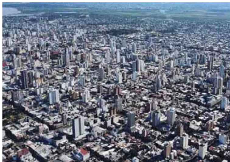
SUBA. Un departamento de un dormitorio que en 2022 valía 55.000 dólares hoy vale 75.000. Aseguran que los precios continuarán en alza.

Respecto a la consulta sobre si se dan operaciones de compraventa de inmuebles en pesos, Govone remarcó: "Hace 40 años que la mayoría de las operaciones se concretan en dólares, pero eso no significa que no se concreten en pesos. Con la aparición de los créditos hipotecarios empezaron a reactivarse las operaciones en pesos, sumado a cierta estabilidad que estamos logrando en cuestiones inflacionarias".