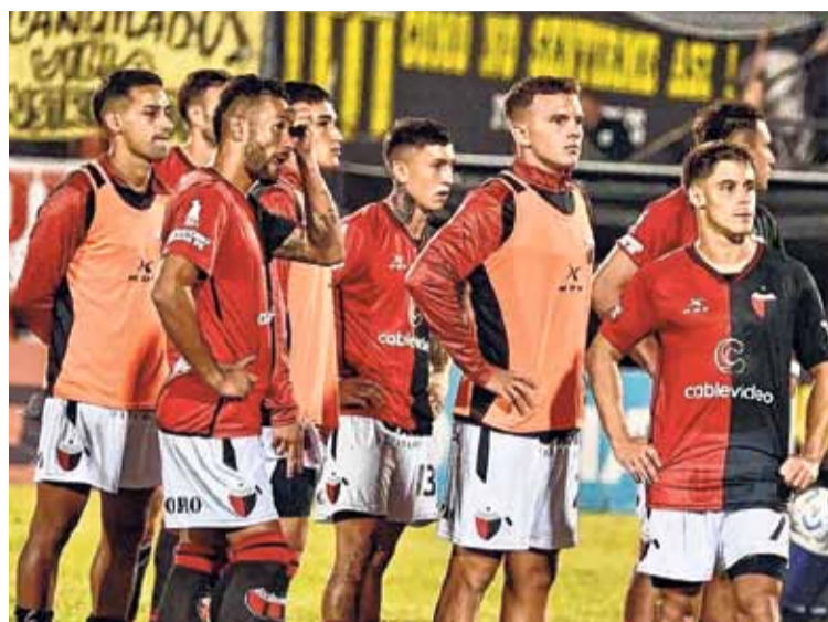
Tropezón. El Sabalero sufrió su primera derrota en la temporada ante Almirante Brown.

Colón tiene un muy buen plantel en relación a los demás