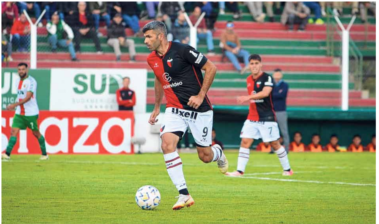
Autocrítica cero. Colón sufrió una nueva derrota y sigue sin encontrar el rumbo en el certamen.

Porque si en realidad están convencidos de lo que manifiestan,