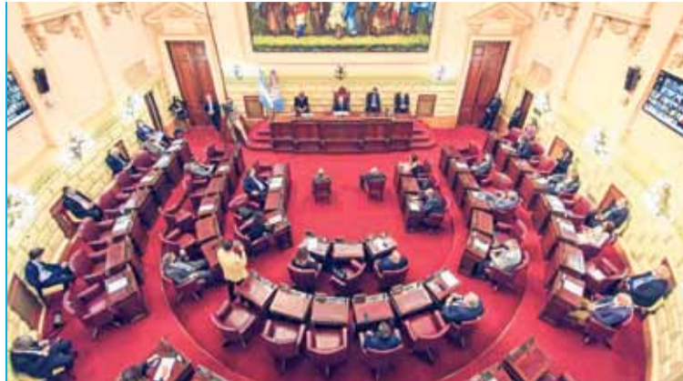
CONVENCIÓN REFORMADORA. Se instalará en la ciudad de Santa Fe, cuando lo disponga el Poder Ejecutivo provincial, dentro del plazo de un año desde la elección.

ampliar el derecho a la libertad de expresión, incluyendo el derecho a buscar, recibir y difundir información. También se prevé la protección de datos personales, del honor y la intimidad, así como el secreto de las fuentes periodísticas. Se incorporará el principio de transparencia activa y el derecho de acceso a la información pública.