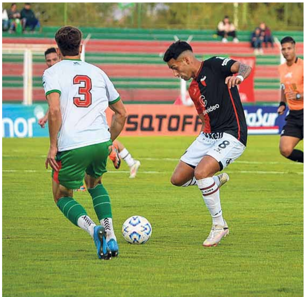
No levanta. El Sabalero sufrió su segunda caída consecutiva, tras perder ante Agropecuario.