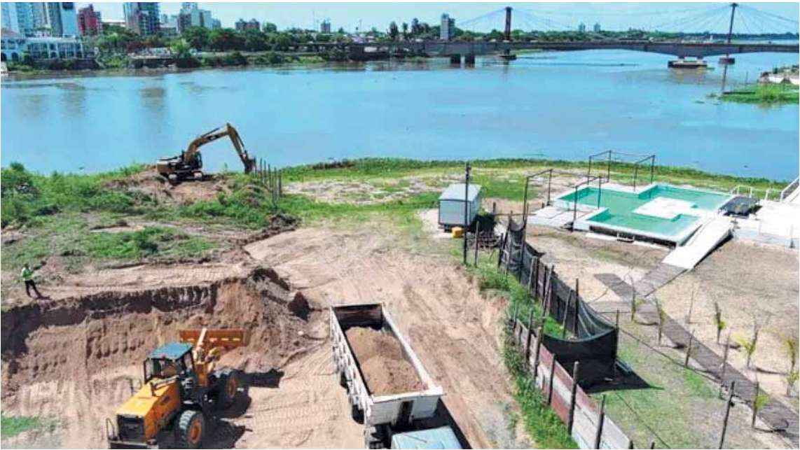
CLANDESTINO. Estas intervenciones ilegales fueron denunciadas por organizaciones de la zona y verificadas mediante informes técnicos oficiales.

Estas intervenciones ilegales fueron denunciadas por organizaciones de la zona y verificadas mediante informes técnicos oficiales, en las que se constató que las obras infringen la Ley de Aguas, al encontrarse emplazadas en Áreas 1 y 2, donde se prohíbe la ejecución de obras en zonas anegables e inundables. Del mismo modo, se detectó el desarrollo de un complejo de verano en terrenos de dominio público, lo que afectó a instituciones ubicadas