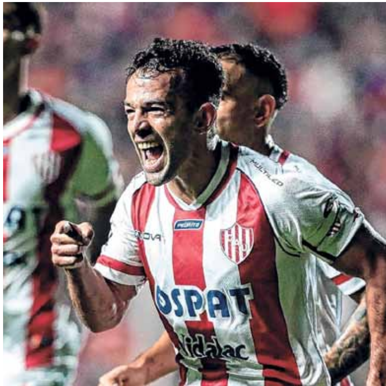
Despedida. El mendocino dejó una profunda huella en el corazón de los tatengues.

A la hora de dejarle un mensaje a los hinchas dijo: “Al hincha le digo gracias eternamente por el respeto que tuvieron conmigo. La espina que tengo es la de no haber podido ganar un campeonato. Pero estoy seguro que más temprano que tarde Unión va a ganar un torneo por que se están haciendo bien las cosas”.