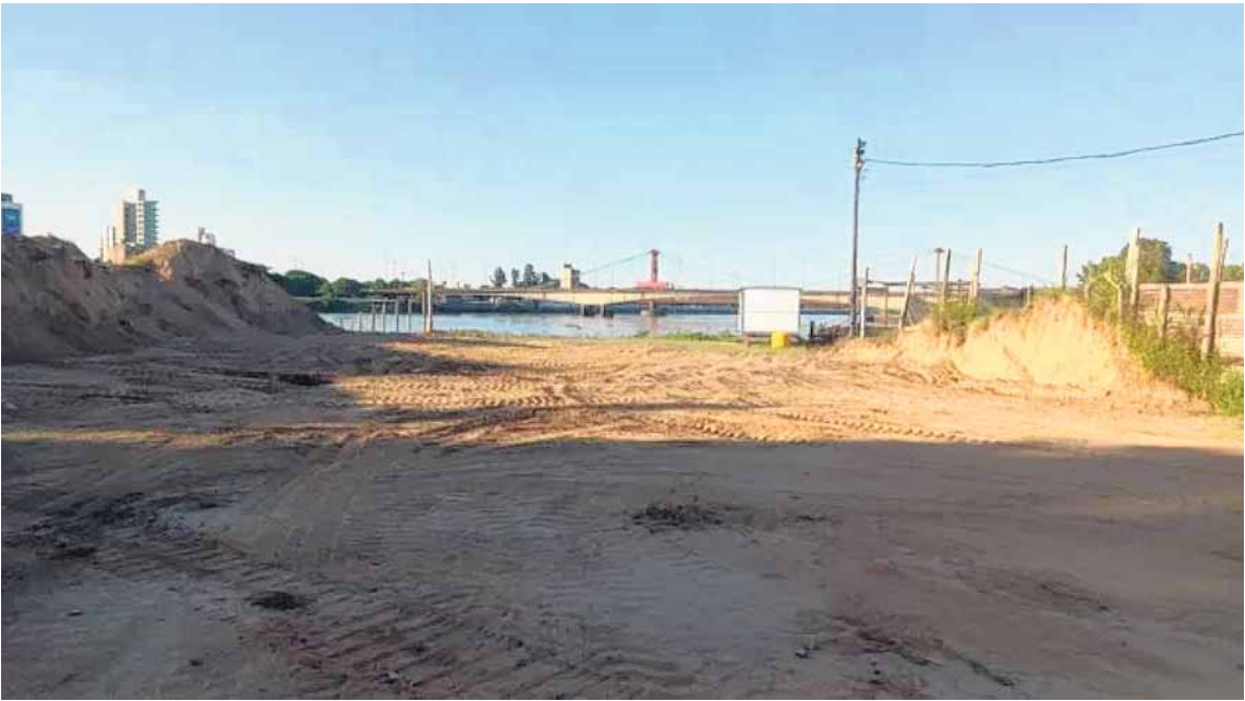
ÁREA AFECTADA. El personal técnico del área realizó múltiples intimaciones y advertencias a la empresa responsable.