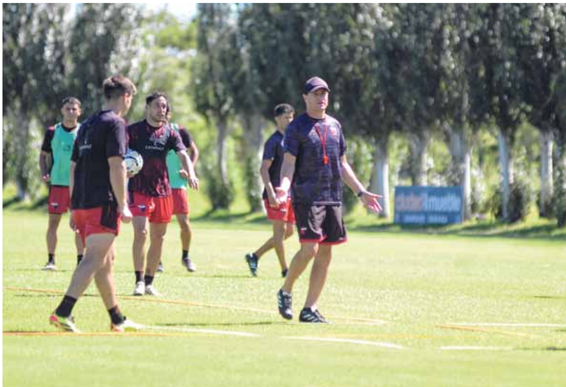
Convicción. El DT pretende un equipo competitivo y protagonista para la Primera Nacional.

El entrenador fue más allá y ponderó el recorrido del futbolista, más allá de que la negociación aún no esté cerrada. “Creemos que es un jugador