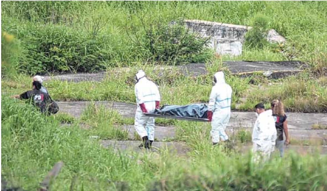
BARRIO CHALET. El lugar en donde fue hallado el cuerpo sin vida.

Los objetos personales y las condiciones del cuerpo fueron constatados en el lugar, mientras los análisis científicos apuntan a precisar el origen del fallecimiento del adolescente de 15 años que era buscado desde el 18 de diciembre