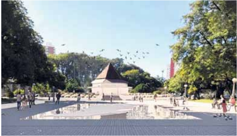
REFORMA. Se difundieron renders oficiales que muestran una nueva configuración del mapa de la provincia y un espejo de agua en reemplazo de la estructura actual.

El debate también se trasladó a las redes sociales, donde numerosos usuarios manifes-