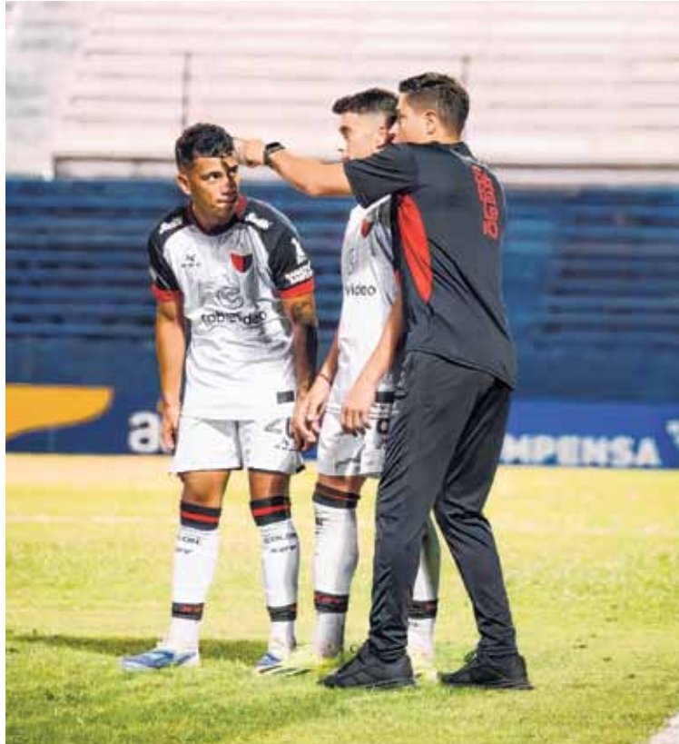
Renovado. Colón se nutrió con jugadores de experiencia y jerarquía para la categoría.

En la zona media, la dupla de volantes centrales estará integra-