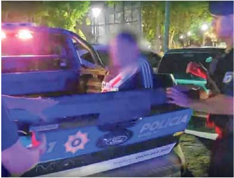
PENAS. Las sanciones previstas se limitan a multas y contravenciones, lo que no logra desalentar la actividad.