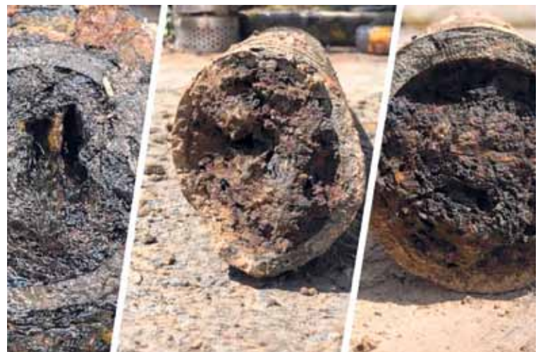
INTERVENCIÓN. La obra contempla el recambio de 12 kilómetros de cañerías y más de 1.600 conexiones domiciliarias.

De esta manera, Santa Fe pretende avanzar hacia un sistema de agua potable más moderno, seguro y acorde a las necesidades de sus vecinos, un proceso que hoy queda reflejado en imágenes que muestran el antes y el después de una infraestructura esencial.