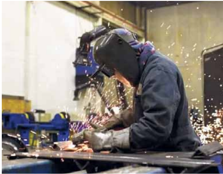
INDUSTRIA. El empresario comparó el escenario actual con procesos anteriores de apertura económica, como los ocurridos durante la última dictadura y en los años noventa.

El empresario comparó el escenario actual con procesos anteriores de