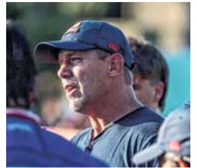
La idea fija. Galatro remarcó la gran preparación que está haciendo Capibaras XV.

Destacó que “me gustó mucho el line out, me gustó más allá de los cincuenta y siete puntos, la organización defensiva fue bueno para el tiempo que la pudimos entrenar,