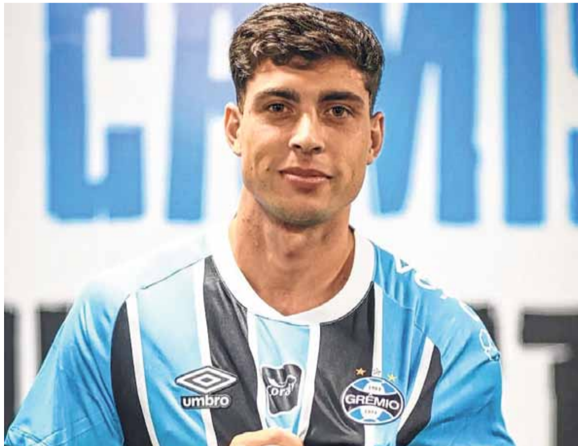
Tajada. Unión espera su parte por el 30% que tenía de Nardoni.

por 8 millones de dólares por el 80% de la ficha de Nardoni. Racing cobró 2 millones en esta primera etapa, quedándole aproximadamente 5,6 millones tras descontar la participación que debería recibir Unión, que hasta ahora no fue acreditada. Además, la operación contempla un bonus de 2 millones por objetivos deportivos, ligados a la cantidad de partidos que el jugador dispute en su nuevo club. De ese monto adicional, 600.000 dólares serían para Unión si se cumplen las condiciones pactadas. Racing seguirá recibiendo dinero en cuotas por la transferencia, pero hasta ahora no hay claridad sobre cómo se distribuirán los pagos ni los plazos de cada uno.