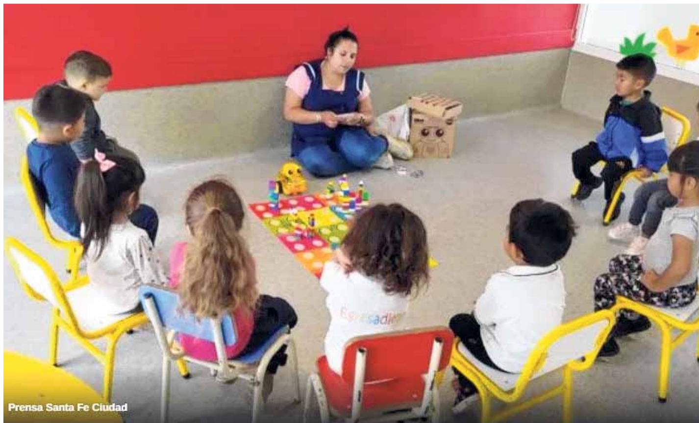
Prensa Santa Fe Ciudad

Según explicó, en diálogo con el programa Mañana UNO (UNO 106.3), en varias instituciones comenzaron a fusionarse salas de tres y cuatro años ante la disminución de alumnos. En algunos casos, se incorporan niños más pequeños para cubrir vacantes.