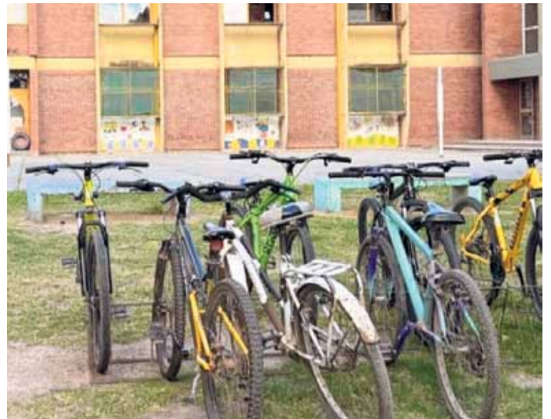
ESCUELA CERRADA. El patio de la Escuela N° 40 Mariano Moreno de San Cristóbal.

Mainer puso el foco también en la responsabilidad de los adultos —tanto en la familia como en la escuela— en generar espacios de escucha real. “Muchas veces los chicos no cuentan lo que les pasa porque minimizan su problema,