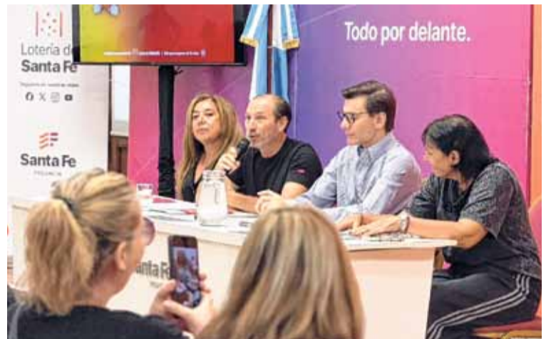
En sociedad. Se viene la Copa Santa Fe de Mamis Hockey.

En cuanto a este torneo, Di Lena agregó “se del desarrollo que ustedes tienen, se del esfuerzo que le ponen, por eso estamos muy