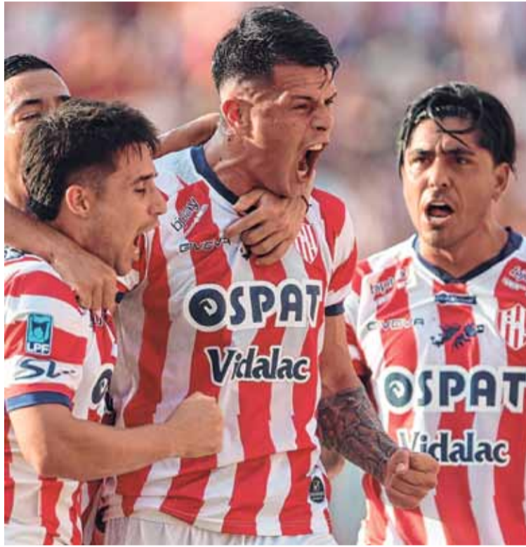
Encendido. El Tatengue ganó gracias a los goles de sus delanteros y sigue soñando.

Mientras juega la base titular, el Rojiblanco marca la diferencia, pero en los segundos tiempos