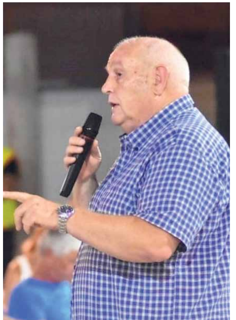
De frente. El presidente de Unión se refirió a la situación económica del club.