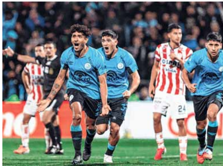
Por primera vez. Belgrano, otro que logró su primer título, lo que sigue buscando el Tate.

tos de peso como los de Emiliano Rigoni y Lucas Zelarayán. Apostó fuerte económicamente con la contratación de Nicolás Fernández, por quien desembolsó 2.300.000 dólares, y además sumó futbolistas determinantes como Lucas Passerini y Franco Vázquez, uno de los grandes aciertos del mercado en los últimos años.