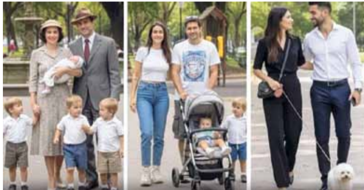
CAÍDA. La provincia de Santa Fe pasó de registrar cerca de 60.000 nacimientos anuales hace apenas una década a unos 34.000 en 2024.

“Es un fenómeno multicausal. Hay factores económicos, culturales y cambios en los proyectos de vida”, señaló.