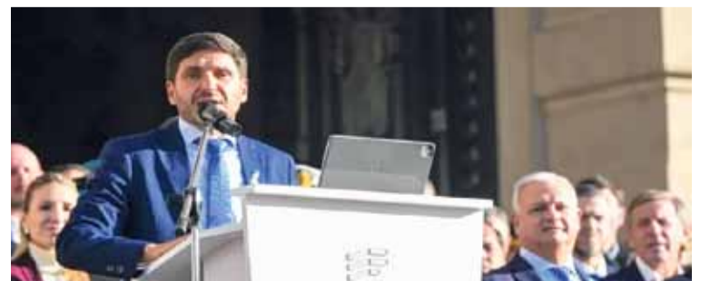
ACTO. Durante su discurso, vinculó libertad con igualdad, defendió la presencia del Estado y convocó a la unidad para “sacar adelante” la provincia y el país.

La jornada patria incluyó además el tradicional Te Deum en la Catedral Metropolitana, un desfile cívico-militar y actividades culturales y gastronómicas organizadas en el centro santafesino. También hubo una feria de emprendedores locales, propuestas vinculadas a los Juegos Suramericanos Santa Fe 2026 y la actuación del Coro Polifónico La Merced.