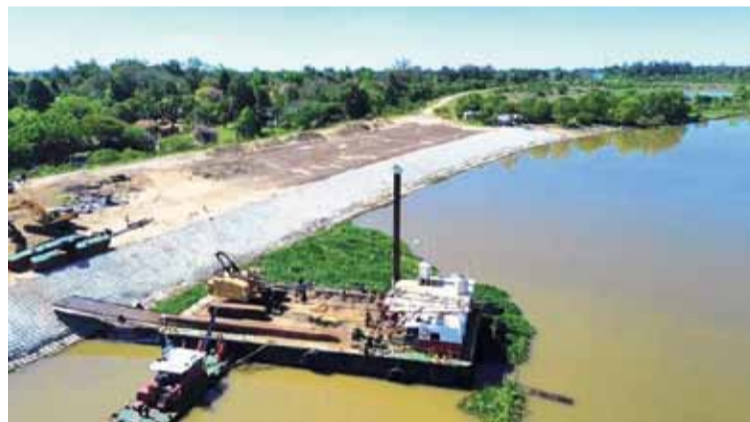
OBRAS. El Gobierno Provincial encara la última etapa del Terraplén Garelo.

Aunque todavía no existe certeza sobre la magnitud que podría alcanzar el fenómeno —leve, moderado o severo—, el escenario comenzó a ser monitoreado con atención por el Gobierno provincial. El antecedente más cercano que aparece como señal de alarma